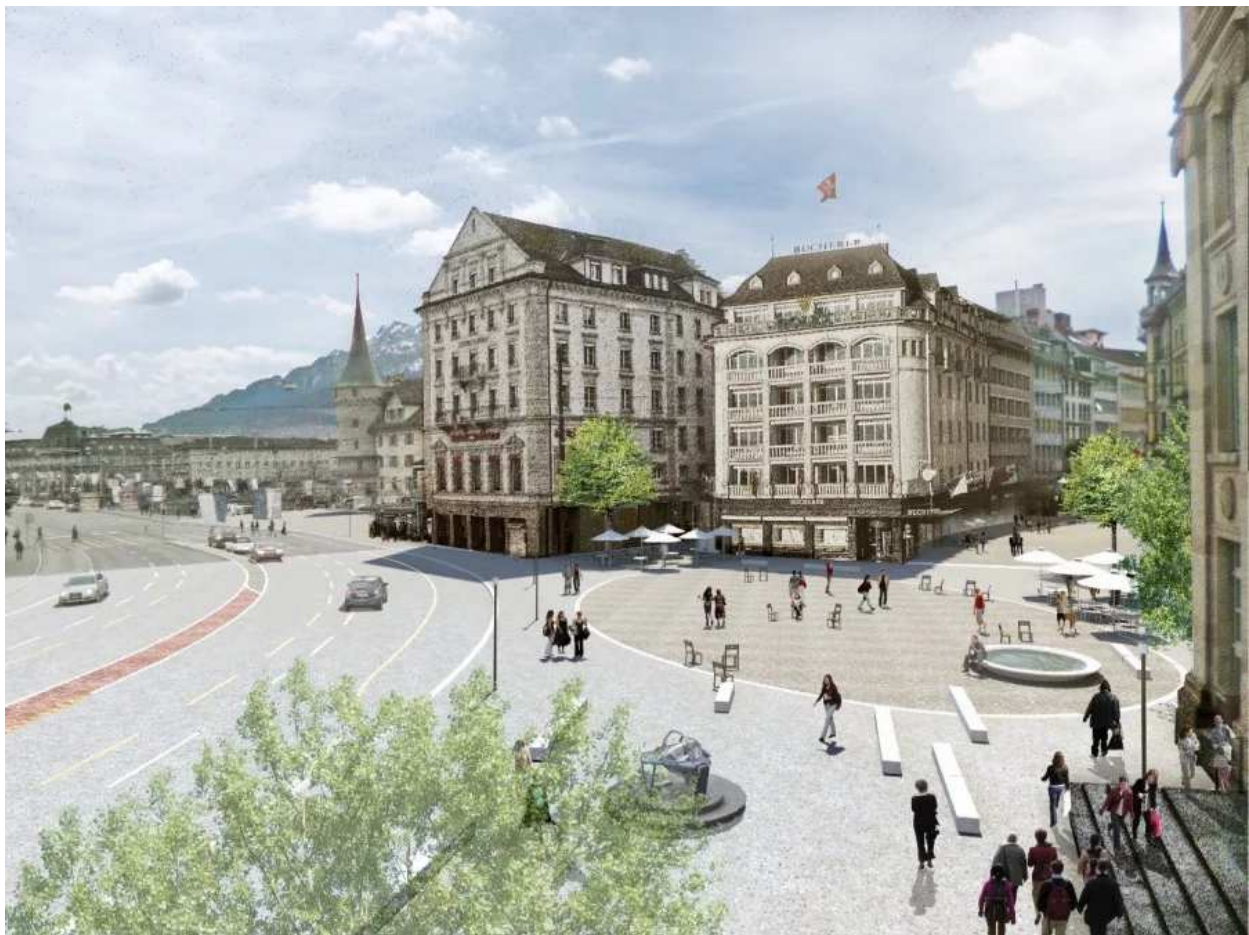
So könnte der Schwanenplatz ohne Cars aussehen.