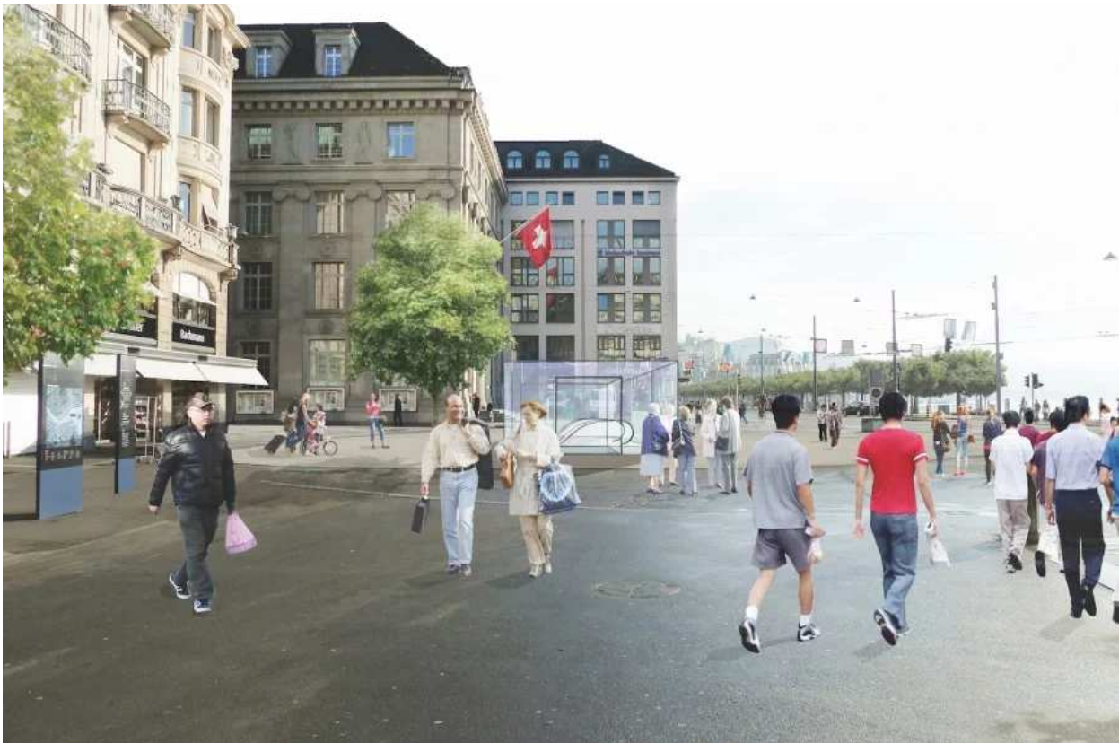
So soll der Eingang zur Metro am Schwanenplatz aussehen.